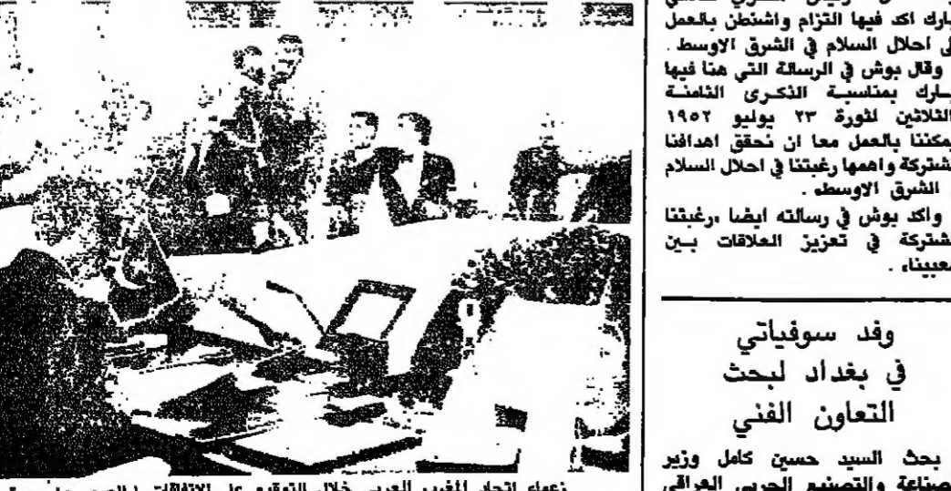
زعماء اتحاد المغرب العربي خلال التوقيع على الاتفاق (الصور من رويترز)

زعماء اتحاد المغرب العربي خلال التوقيع على الاتفاق (الصور من رويترز) قربت دول اتحاد المغرب العربي الخميس امس ارسال مبعوث الى الخليج ليحلل الوسط في النزاع بين العراق والكويت. وقالت وكالة الانباء الفرنسية لقمعة والاتحاد، التي استمرت يومين، عن القلق من جراء الأزمة الأخيرة في الخليج، بين العراق وجاراته الكويت ودولة الامارات العربية المتحدة. ونقلت وكالة الانباء الجزائرية عن البيان قوله ان اتحاد المغرب العربي قرر تلوين رئيسه الحالي الشاذلي بن جديد (رئيس الجزائر) ان يرسل مبعوثاً خاصاً بالنيابة عن الاتحاد الى الدول المعنية. والشريك التجاري الرئيسي لبلدهم وحذر البيان من التنازع السلبي